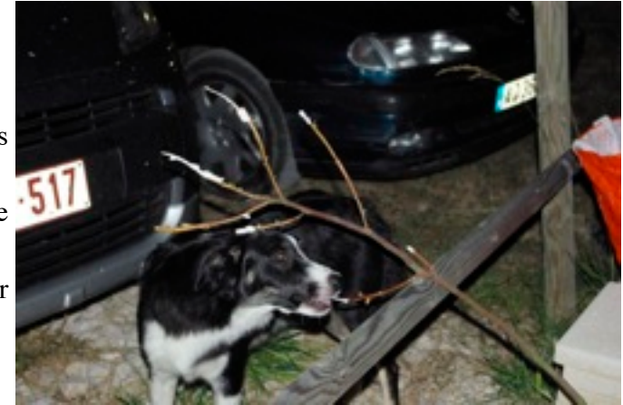
APRES On reste positif